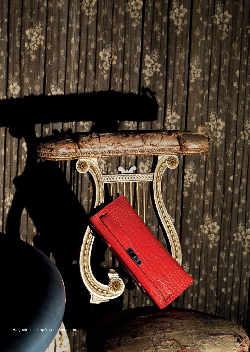
Baignoire de l'impératrice Joséphine.