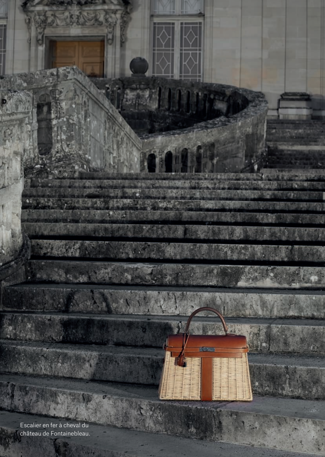
Escalier en fer à cheval du château de Fontainebleau.